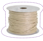
50 cm de ficelle