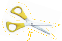
1 paire de ciseaux

LES OUTILS nécessaires pour fabriquer ton pêle-mêle :